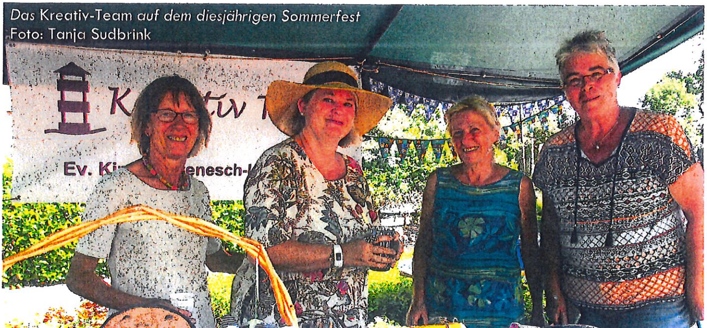
Das Kreativ-Team auf dem diesjährigen Sommerfest